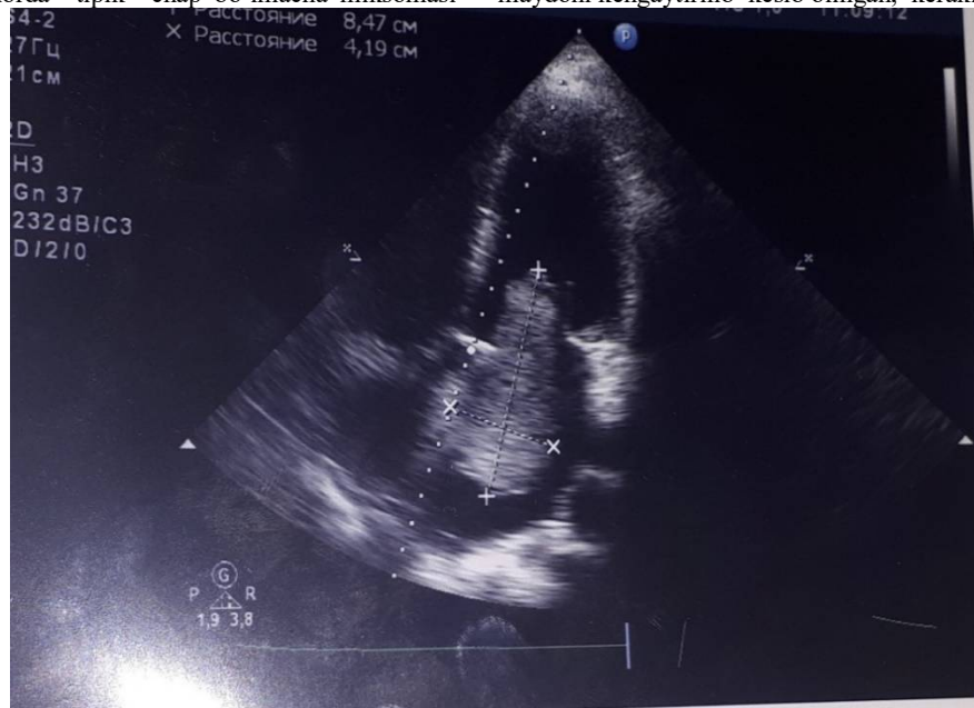
Rasm.4. Chap bo'lmacha Remiksomasi. 5x4sm, mitral darchani qisman berkityapti.

aniqlanib, rejali ravishda operatsiya bo'lgan. Ammo, 2 yildan keyin yana o'sha diagnoz bilan qayta operatsiya ko'rsatgichlari aniqlanganligi bemor qarindoshlari uchun muammo tuyulgan. Birinchi operatsiyani bajargan xirurgga ishonch bildirmay, bizning klinikamizga kelishgan. Vaxolanki, otasida bo'lib o'tgan qiyinchiliklar, o'smaning juda kuchli agressiv o'sishi, kuchli asoratlarga ega bo'lishi, qizida aniqlanmagan. Ikkinchi bemor ayolda o'smaning noagressiv, sekin rivojlanishi ta'kidlangan. Yuqorida keltirilgan faktlar asosida oilaviy miksoma, uning rivojlanishida ham residivga moyillik borligi aniqlandi. Rejali tayyorgarlikdan so'ng, bemor J., 28 yoshda, qayta operatsiyaga - residiv chap bo'lmacha miksomasini olib tashlash amaliyotiga tayyorgangan. Rejali qayta operatsiya xech qanday qiyinchiliklarsiz bajarilgan (prof.X.A.Abdumadjidov). Resternotomiya. Kardioliiz. Kanyulyatsiya. Sun'iy qon aylanishi va kardioplegiya tipik usulda bajarilgan. Reviziyada xaqiqatdan ham o'sha olingan chap bo'lmacha miksomasi o'rnida qaytadan yana o'sma paydo bo'lgan, hajmi 5x4sm (rasm.4), konsistensiyasi, rangi, tuzulishi avvalgi o'smaga o'xshash, yana oval darcha orqali o'sgan. Qisman chap atrioventrikulyar darchani obturatsiya qila boshlagan. O'sma adekvat holda, asoratsiz, butunligicha olib tashlangan. Oval darcha maydoni kengaytirilib kesib olingan, kerakli