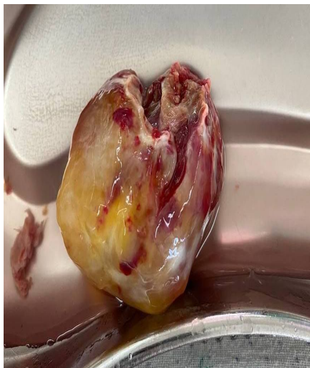
Рasm 3. Remiksoma 5x4sm chap bo'lmachada.