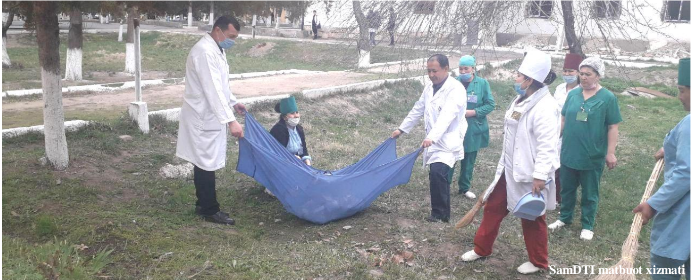
SamDTI matbuot xizmati