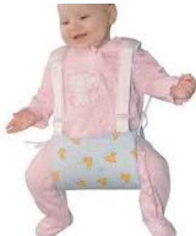
Расм 1. Фрейка ёстикчаси

Даволаш ва тадқиқотлар натижалари. Соннинг туғма чиқишини функционал усулда Фрейка ёстикчасида даволаш. Икки-уч ойликкача бўлган 21 беморга ҳам Фрейка ёстикчаси қўлланилди. Мазкур ёшдаги болаларда сон мушакларининг тонуси барқарорлашган бўлиб сонни ташқарига кериш ҳажми ҳам чекланган 60 0 -65 0 оралиғида бўлди.