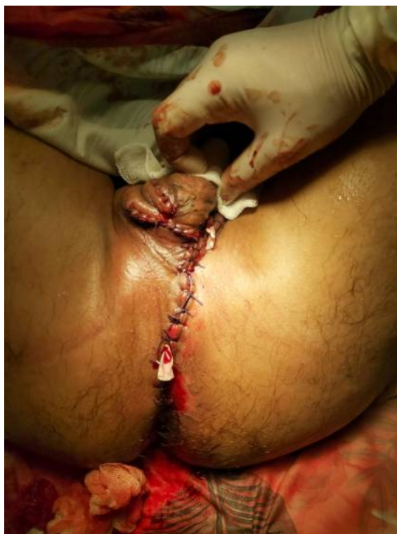
Рис. 2. Фасциальная пластика промежности, паховой области и яичек

После соответствующей предоперационной подготовки больной оперирован (рис. 2).