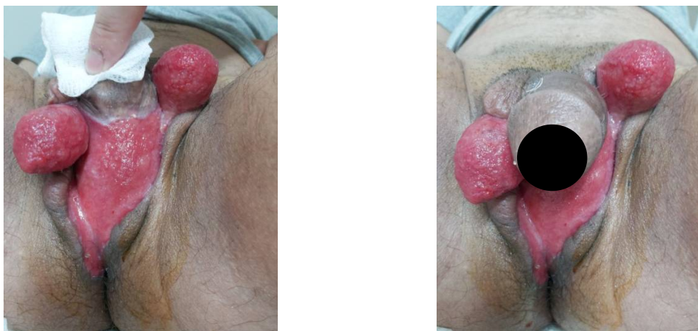
Рис. 1. Внешний вид половых органов пациента Д., 40 лет. Обширные гранулирующие раны промежности, паховых областей и обоих яичек.

Локальный статус: наружные половые органы развиты нормально, в промежности, на обоих яичках и под половым членом кожные покровы отсутствуют, имеется обширная гранулирующая рана размерами 17x15 см, вокруг отмечается выраженная гиперемия (рисунок 1).